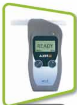
Alert J5 mobile