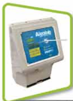
en entreprises et ateliers