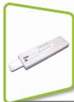
dépistage de drogue par la salive