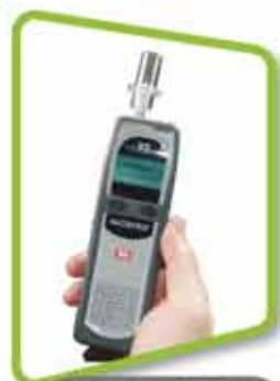
à bord du véhicule