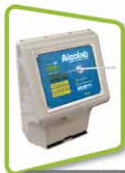
en entreprises et ateliers