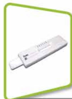
dépistage de drogue par la salive