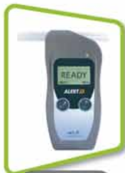
Alert J5 mobile